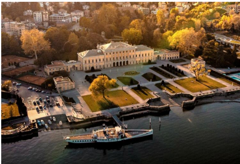
Villa Olmo - Como

L'aeroporto più vicino, collegato tramite servizio ferroviario con Como, è Milano Malpensa. Le stazioni ferroviarie più vicine sono Chiasso (CH), Como San Giovanni o Como Lago.