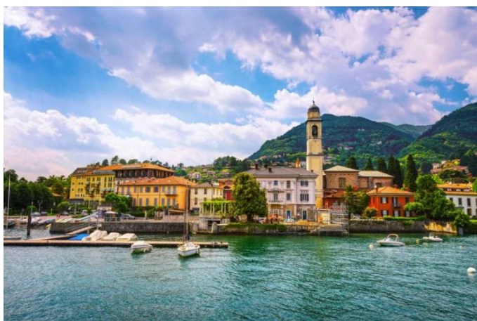
la Riva di Cernobbio

Il pranzo avrà luogo in strutture convenzionate.