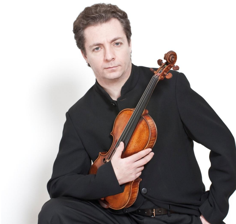
Pavel Berman, violinista

Il costo della masterclass - ovvero comprensivo di quota associativa ad Associazione Culturale Polifonie, frequenza lezioni, pianista accompagnatore, vitto e alloggio presso strutture alberghiere convenzionate - è di 690 € a persona. In caso si voglia partecipare solo alle lezioni (escluso quindi vitto e alloggio) il costo è di 400 € a persona.